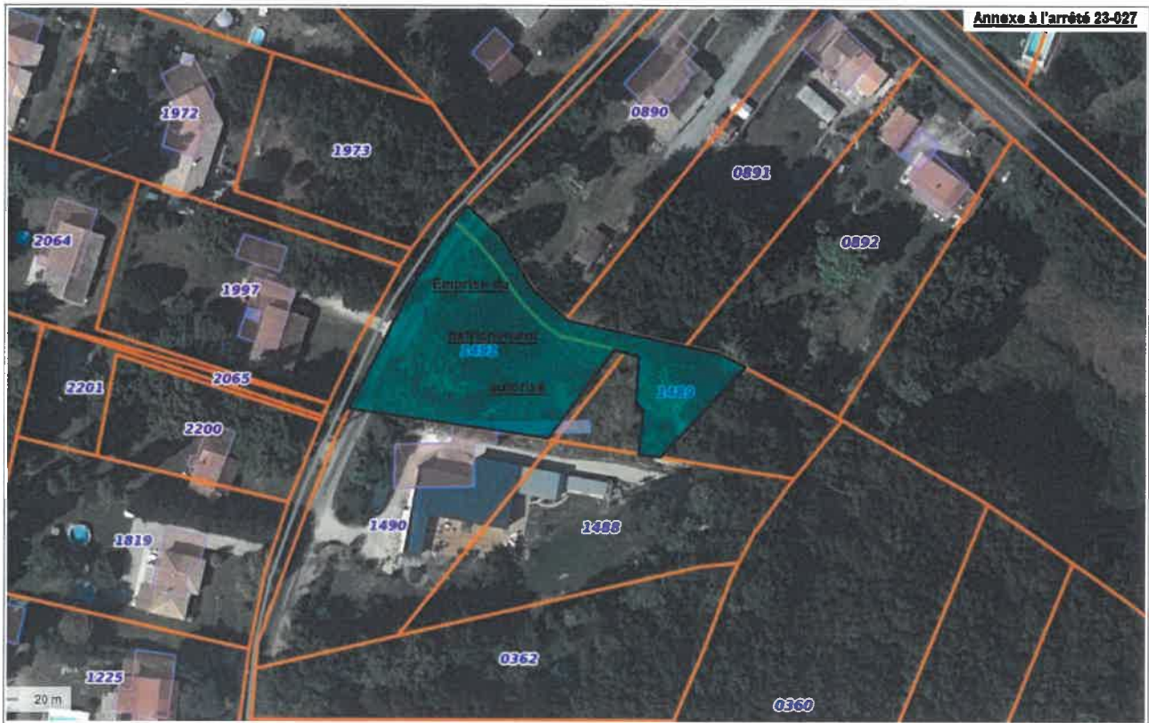
Vue rapprochée avec cadastre